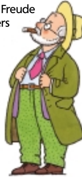
Ditz Atrops – sturzbesoffen, aber kerzengerade