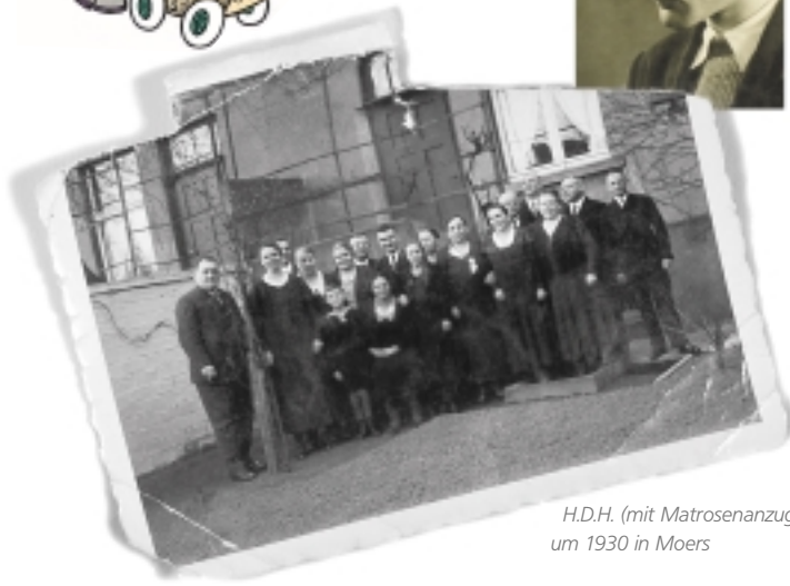
H.D.H. (mit Matrosenanzug) um 1930 in Moers